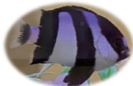
ミスジリュウキュウスズメダイ (白黒ちゃん)