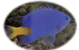
シリキルリスズメダイ (アオ)